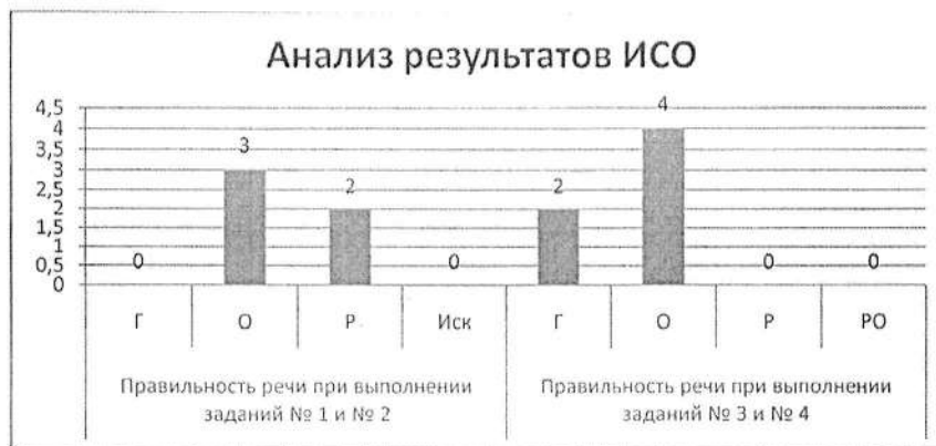
Оценка правильности речи выпускников при выполнении заданий